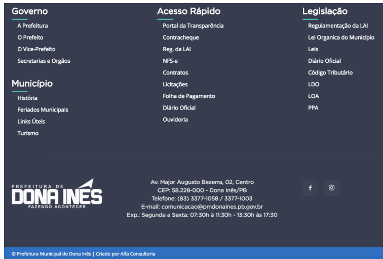
Figura 9 - Rodapé

No rodapé é disponibilizado o mapa do site , com todos os menus, acessos e seus respectivos links. Além disso, no rodapé também é disponibilizado a logomarca do ente, informações de localização, contato e ícones de redes sociais.