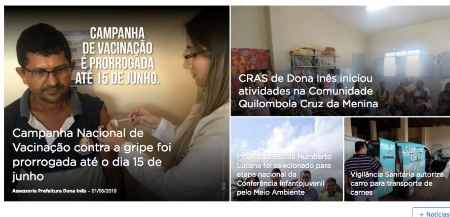
Figura 5 - Módulo de notícias mais recentes

O módulo de notícias é onde ficam disponibilizadas as notícias mais recentes postadas no site. As notícias postadas se referem a atos da gestão do ente ou divulgação de prestação de algum serviço.