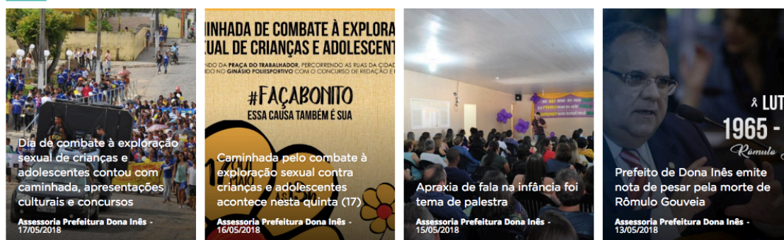
Figura 8 - Galeria de mídias